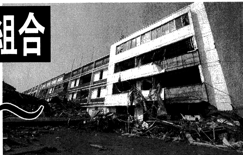
津波で被災した福前高田市役所