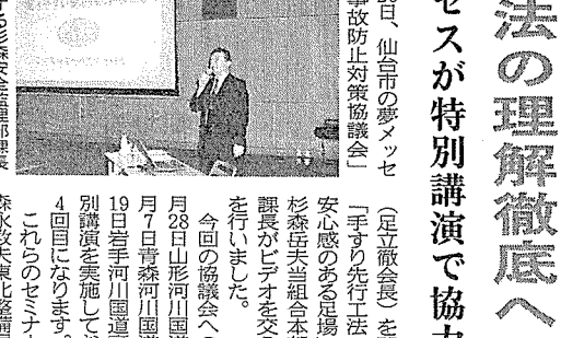
特別講演する杉森安全監理部長