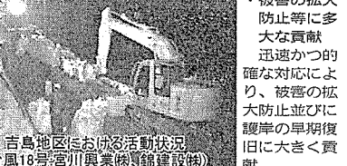
吉島地区における活動状況(台風18号(宮川川奥橋)橋建設時)

中国地方整備局の災害復旧活動の表彰一例 国土交通省中国地方整備局では、防災意識の向上を目的として、地震・風水害・雪害などの災害対策に功績のあった個人や団体を、その顕著な功績を顕彰し「災害対策関係功労者」として今年度から表彰することとしました。 このたび平成16年度に発生した災害における表彰対象者を決定し、下記の通り表彰式を行いました。 日時：平成17年7月6日(水) 10:30~11:30 八丁郷サンテ4階 サルビア(広島市中区上八丁郷8-28) 平成16年の台風16号に伴う高潮・波浪により広島市南区出島地区において浸水被害が発生した際に、土壌積み作業に尽力されました。また、台風18号に伴う高潮・波浪により広島市中区吉島地区において護岸崩壊等が発生した際に応急復旧等に尽力されました。 ・緊急な要請にも迅速に対応 吉島地区において護岸崩壊等が発生した際に、約7時間大型土機による護岸の仮復旧を行うなど、緊急な要請にも迅速に対応。 ・過酷な条件下において作業を完遂 風雨と波浪の過酷な状況下において、大型土機などの作業を完遂。