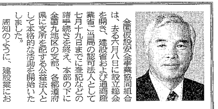
ACCESS新聞発刊によせて

全国仮設安全協同組合は、去る6月1日に設立総会を開催し、建設省及び労働省の承認を受け、正式に設立された。本報の発刊は、本組合の活動の中心となる。本組合は、建設現場での労働者の安全を確保し、労働者の健康と安全を確保することを目的として活動する。本組合は、建設現場での労働者の安全を確保し、労働者の健康と安全を確保することを目的として活動する。