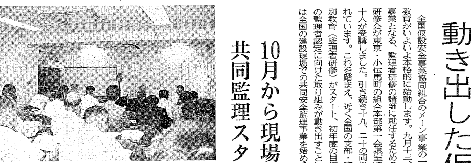
10月から現場での共同監理スタート

全国仮設安全協同組合は、去る6月1日に設立総会を開催し、建設省及び労働省の承認を受け、正式に設立された。本報の発刊は、本組合の活動の中心となる。本組合は、建設現場での労働者の安全を確保し、労働者の健康と安全を確保することを目的として活動する。本組合は、建設現場での労働者の安全を確保し、労働者の健康と安全を確保することを目的として活動する。