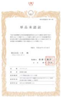
社団法人仮設工業会単品承認証